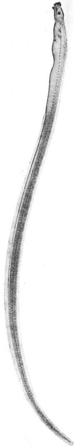
Fig. 3. Larve. Grassi, pl. X, fig. 1.

n. a. narine antérieure. n. p. narine postérieure.