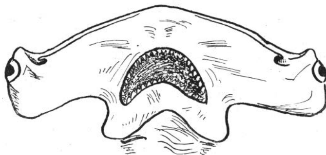
Fig. 2. — Tête, face inférieure, d'ap. MOREAU, Hist. N. Poiss. France, t. 1, p. 325, 1881.