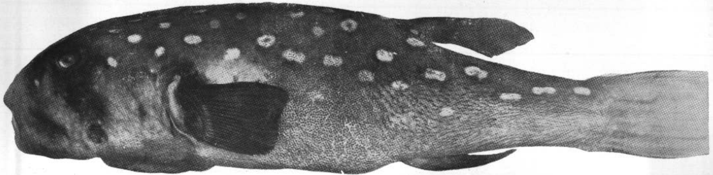
FIG. 1. — Ehippion (Tetrodon) guttifer Bennett. Vue latérale.